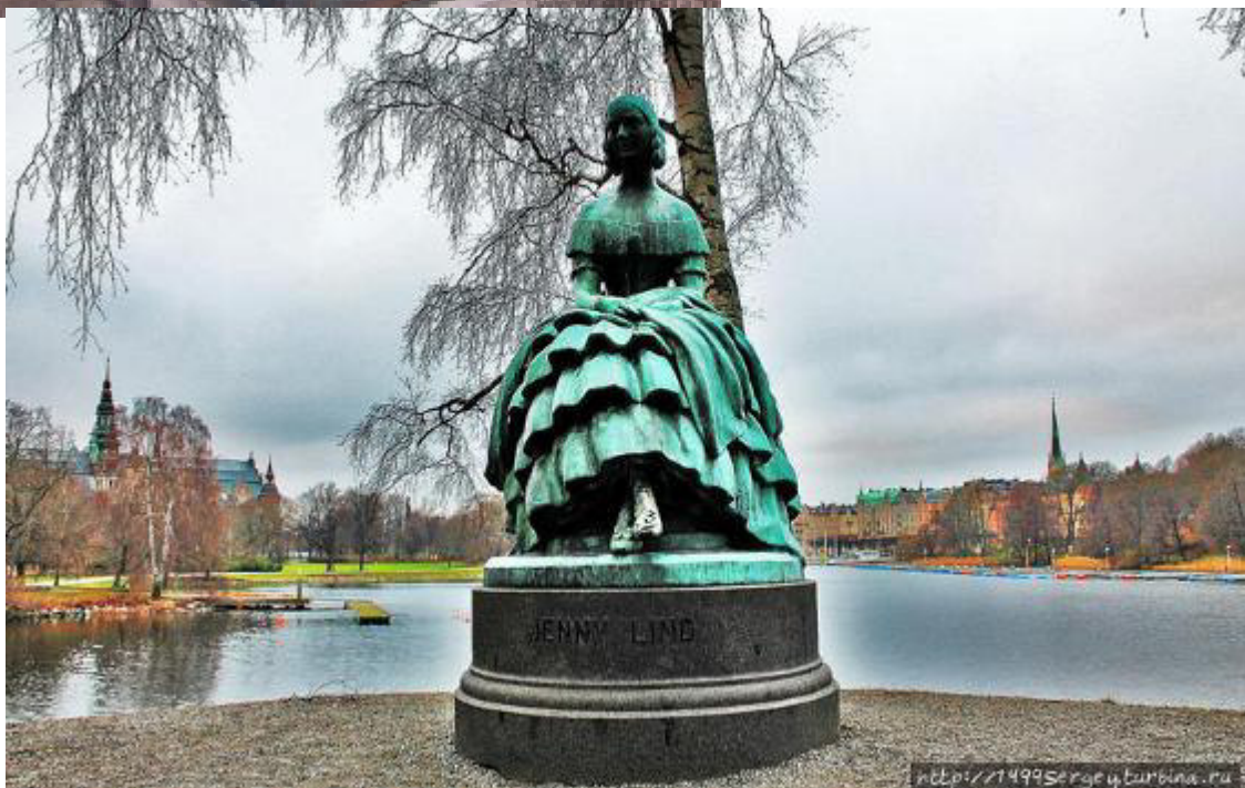
Стокгольм, Юргорден, парк Дженни Линд