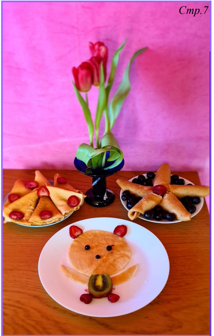
Творческие блины от Сидоровой Дианы