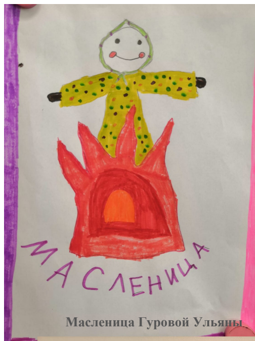
Масленица Гуровой Ульяны