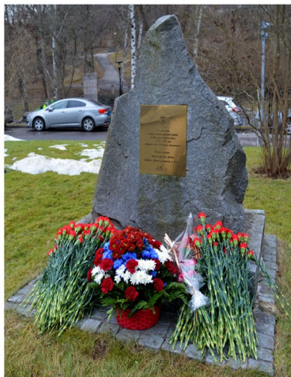
Памятный камень российским военнопленным времен русско-шведской войны 1788-1790 гг., г.Стокгольм, территория Посольства России в Швеции